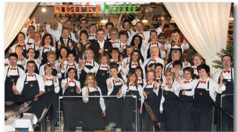
Hochmotiviert: das Team der Markthalle freut sich auf die Besucher der Genuss-Messe.

Neu in der Markthalle: dreimal Gastronomie - essen, trinken, genießen!