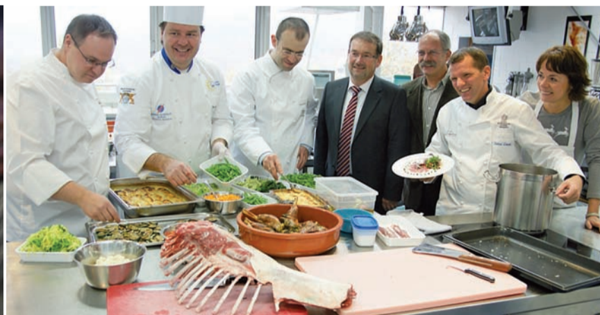
Wir danken für die freundliche Unterstützung der Volksbank Baden-Baden/Rastatt

Im Rahmen der Aktion „Genuss in der Schule“ im Vorprogramm der „fine“ beteiligten sich außerdem Schüler des Pädagogiums Baden-Baden (Thema Highland-Cattle aus dem Oostal), die Grundschule Balg (Thema Kartoffel) und die Von-Drais-Hauptschule in Gernsbach (Thema Herbstkräuter). Genießen kann